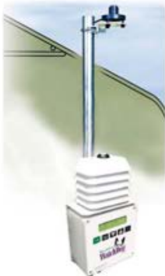
3686WD with 36681

La estación de crecimiento vegetal monitorea y registra la temperatura, la humedad, y la luminosidad. Intégrela con un sensor de luz quantum (como se muestra a la izquierda) y podrá comparar la luz disponible en el exterior con la luz que llega a sus plantas dentro del invernadero. Muestra las condiciones actuales y resúmenes de hasta 12 meses en la pantalla LCD. También muestra los promedios de temperatura, DLI y el diferencial de temperatura día/noche.